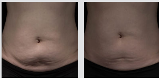
治療前和兩次治療後