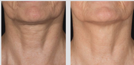
治療前和一次治療後